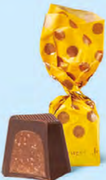
CHOCOLAT NOIR Praliné avec éclats de crêpe dentelle

BOITE DE 245 G NET 19 SUJETS ASSORTIS AU PRALINÉ 7 RECETTES