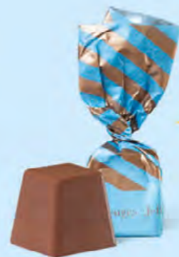
CHOCOLAT AU LAIT Praliné et sucre pétillant