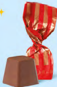
CHOCOLAT AU LAIT Praliné noisettes façon pâte à tartiner