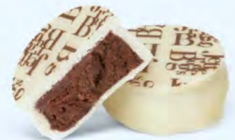
Puissante ganache de chocolat noir au cacao de Sao Tomé, chocolat blanc

BOITE DE 250 G NET 24 PALETS ASSORTIS 4 RECETTES