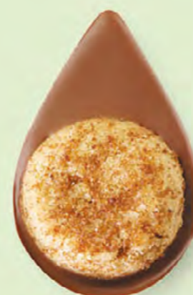
BISCUIT NOISETTES Chocolat au lait 35% de cacao