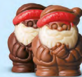
Duo praliné et caramel ou praliné et éclats de noisettes caramélisées