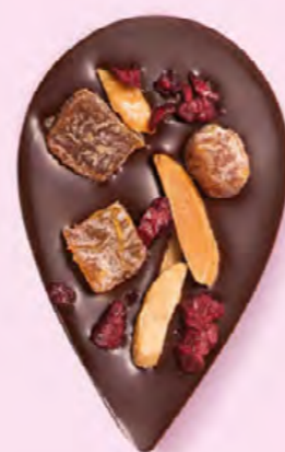
JULIETTE & TOM Chocolat noir 60% de cacao, dés d'abricots secs, amandes caramélisées et morceaux de cerise