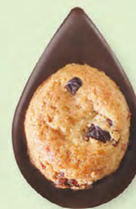
BISCUIT CRANBERRIES Chocolat noir 60% de cacao