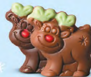
Praliné et éclats de noisettes torrifiées ou praliné et éclats de crêpe dentelle