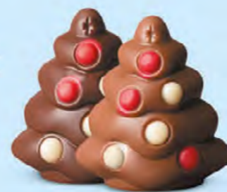
Praliné et sucre pétillant ou praliné et éclats de nougat

Nos choco'pralinés font partie de la magie de Noël. Ils plaisent aux petits... comme aux grands !