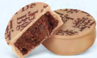
Ganache aromatique de chocolat noir au cacao d'Équateur, chocolat blanc caramélisé