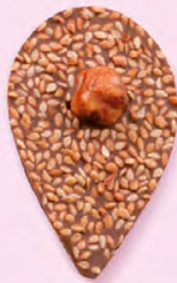
GRAINE DE JULIETTE Chocolat au lait 35% de cacao, sésame, noisette caramélisée