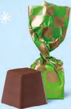
CHOCOLAT NOIR Praliné façon rocher aux éclats de noisettes