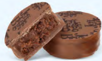
Ganache de chocolat noir au cacao fruité de Saint-Domingue, chocolat au lait 36% de cacao