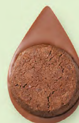
BISCUIT BROWNIE Chocolat au lait 35% de cacao

Les prix barrés sont les prix de vente TTC maximum en boutique. *Prix de vente TTC maximum.