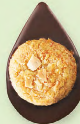
BISCUIT AMANDES Chocolat noir 60% de cacao