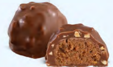
Praliné aux noisettes et éclats d'amandes, chocolat au lait 36% de cacao