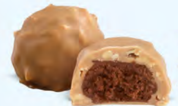
Praliné aux noisettes et éclats d'amandes, chocolat blanc caramélisé