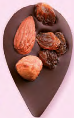
JULIETTE IN THE CITY Chocolat noir 60% de cacao, amande, noisette, raisins secs