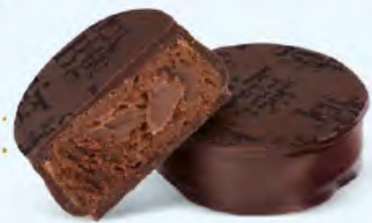
Ganache corsée de chocolat noir au cacao du Venezuela, chocolat noir 70% de cacao

Venezuela, Saint-Domingue, Équateur, Sao Tomé... Une invitation au voyage vers les plus fameuses origines de cacao.