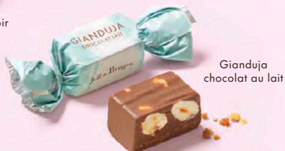
Gianduja chocolat au lait