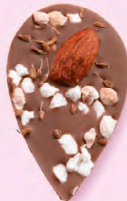
LE SONGE DE JULIETTE Chocolat au lait 35% de cacao, amande, éclats de nougat, brins d'anis