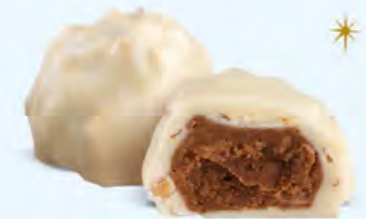
Praliné aux amandes et éclats d'amandes, chocolat blanc