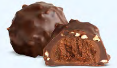
Praliné aux noisettes et éclats d'amandes, chocolat noir 60% de cacao